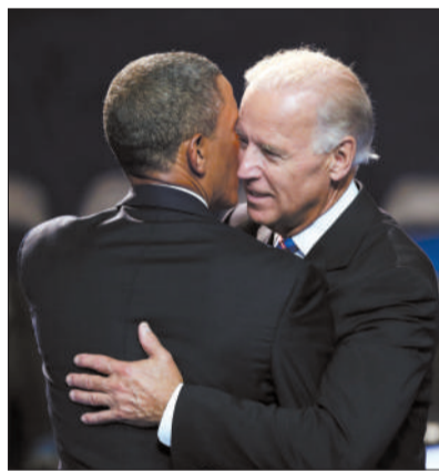
9月6日，拜登接受民主党的副总统候选人提名，奥巴马对其表示祝贺。