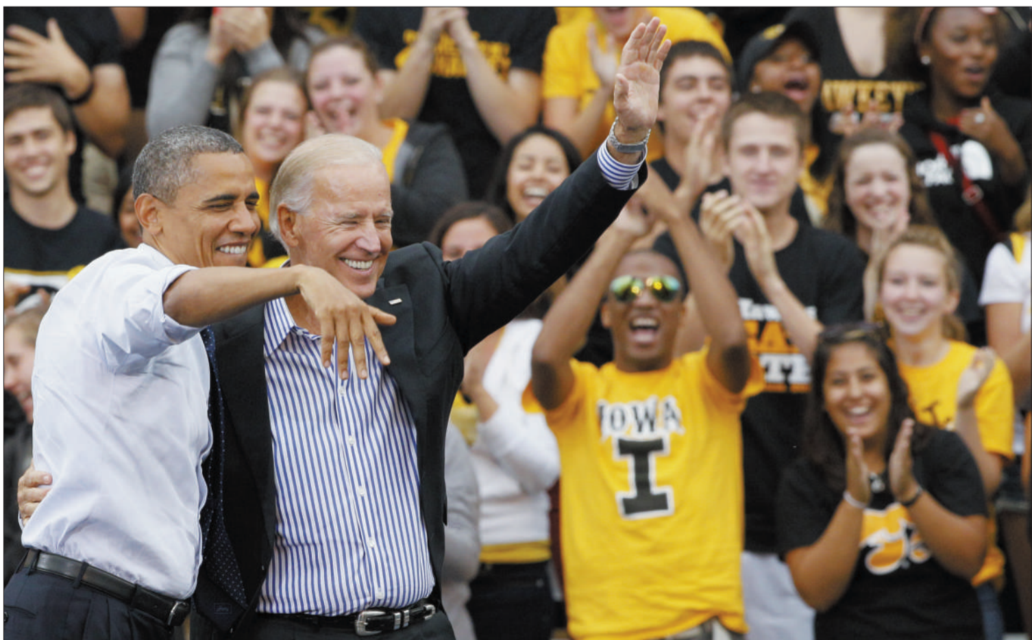
9月7日，民主党总统候选人奥巴马和竞选搭档拜登在艾奥瓦州的竞选活动上一起向支持者挥手致意。