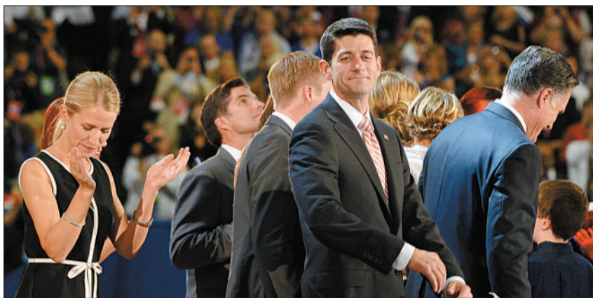
8月30日，罗姆尼和瑞安接受提名，正式成为共和党总统和副总统候选人，家人走上台跟他们一起庆祝。