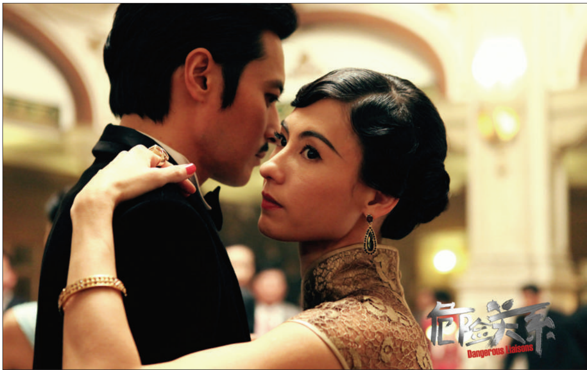
《危险关系》在国内取得5400万元票房后，在韩国的大银幕上继续升温。