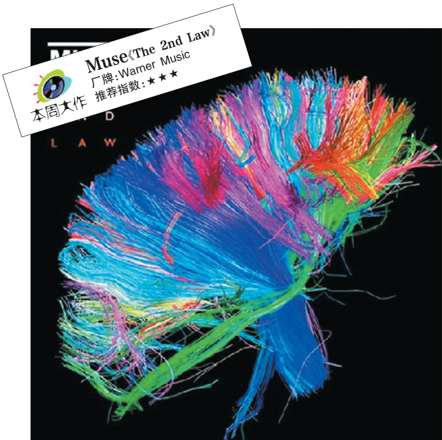
封面上色彩艳丽的塑料丝如鲜花一般绽放，正如唱片中的音乐透出了 Muse 的野心。

Muse 在 10 月份发行的这张新作《The 2nd Law》被大家期待已久，以至于就连他们奥运会舞台上的演出都被人当做是在为这张新作预热。这也难怪，疲软的英国音乐市场的确需要一针清醒剂来提神，而 Muse 那独一无二的音乐气质与 Neo-Progressive 的进取精神，似乎都印证着他们正是最佳候选人。