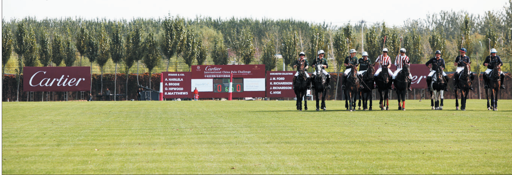
10月14日,“2012卡地亚国际马球中国挑战赛”决赛在北京唐人马球马术俱乐部落下帷幕,卡地亚队荣膺冠军。