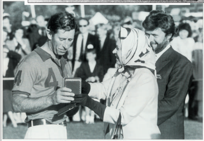
威尔士王储自英国女王手中接过奖牌。