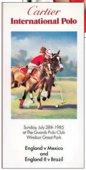
▲卡地亚国际马球赛邀请函。资料图片