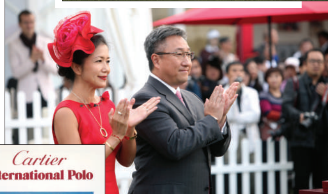
◀卡地亚区域行政总裁(北亚洲)陆慧全先生及卡地亚中国区行政总裁简雅汶女士。 ▼威尔士王储查尔斯与(右)爱丁堡公爵在马上球场上对战。