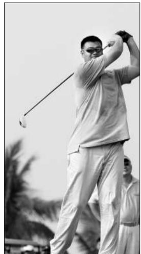
都是体育明星,但罗纳尔多挥杆要比姚明协调一些。