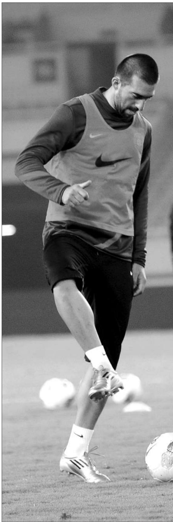
达纳拉赫将是恒大防线的最大威胁。