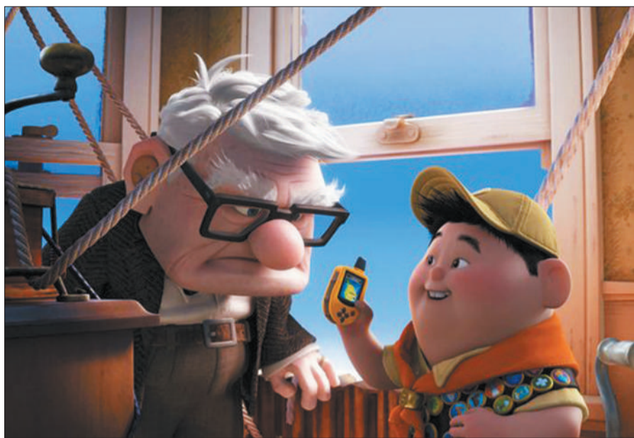
皮克斯的动画《飞屋环游记》。

如果你指望在这本书里看到《海底总动员》的原画，《虫虫特工队》的电脑三维模型，或者《飞屋环游记》的故事剧本，那你就失望了。《皮克斯：关于童心、勇气、创意和传奇》(以下简称《皮克斯》)并不是一部“图文并茂”的书，而是一部给成年人看的，严肃的字书。