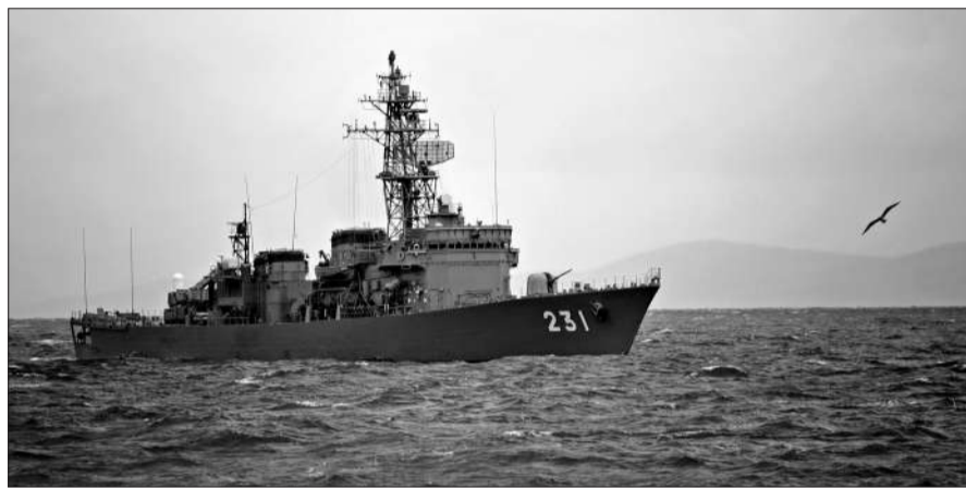
9月26日,俄罗斯符拉迪沃斯托克,参加日俄军演的日本军舰。

上月,日本与俄罗斯在远东符拉迪沃斯托克市的彼得大帝港举行联合军演,演习内容为反海盗,据悉,该演习拒绝中国媒体采访。此次并非日俄首次军演,去年9月,日俄也举行类似军演,俄罗斯当时派出海军“瓦良格”号大型导弹巡洋舰以及补给舰等3艘军舰参与军演。(宗新)