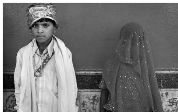
2010年5月,印度,一名7岁女孩与11岁男孩结婚。

据印度内政部全国犯罪统计局的报告显示,印度每年因嫁妆争议死亡的女性逐步增加,多数是自杀。而仅在2007年一年,遭丈夫或夫家虐待而受伤者就有75930人。(韩旭阳)