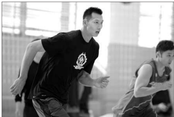
昨日,易建联完成了体能补测。