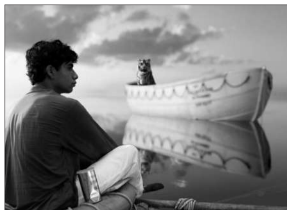
李安首次尝试3D技术拍摄影片,从预告片来看,影片的视效是一大看点。