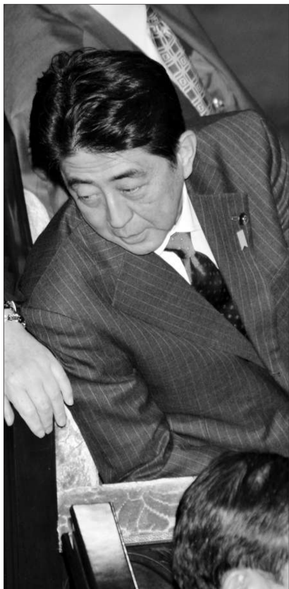
◀29日,东京,野田佳彦首相在发表施政演说。 ▶29日,东京,自民党总裁安倍晋三在等待野田发表演说。

29日,自民党在众议院鹿儿岛3区选举中获胜,总裁安倍晋三表示,“我们受到民众支持,准备积极进军国会。我们将指出民主党问题点,尽全力让野田兑现‘近期内’解散众议院的承诺。” (宗新)