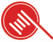
中国艺术拍卖20年之交易板