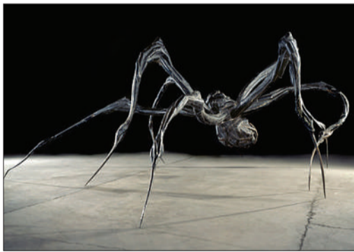
2003年作品《潜伏的蜘蛛》。

1911年生于法国巴黎。尽管从1938年起她一直居住在美国纽约,法国的童年时光仍是她最主要的灵感来源。她以身体为原形,全面探索了人类的生存状况。其主要展览包括1993年威尼斯双年展(1999年又在威尼斯获得金狮奖);伦敦泰特现代美术馆回顾展(2007-2008)等。