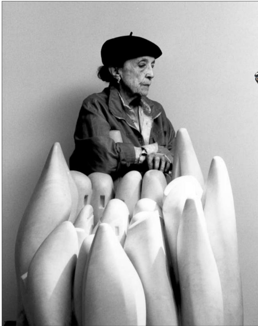
1990年,路易斯·布尔乔亚与她1970年创作的雕塑“Eye to Eye”一起。

上世纪90年代末,布尔乔亚重新挖掘出“善良的母亲”这一概念,赋予编织者全新的形象,“蜘蛛”系列就是在此时产生。格罗威指出,布尔乔亚的母亲曾是一位编织者,能将磨损和毁坏的挂毯重新修复,布尔乔亚认为缝纫用的针拥有修复的力量,而她自己则是通过艺术来编织她的安全网,“她早期作品以父亲为灵感,而晚期则是以母亲为灵感。”