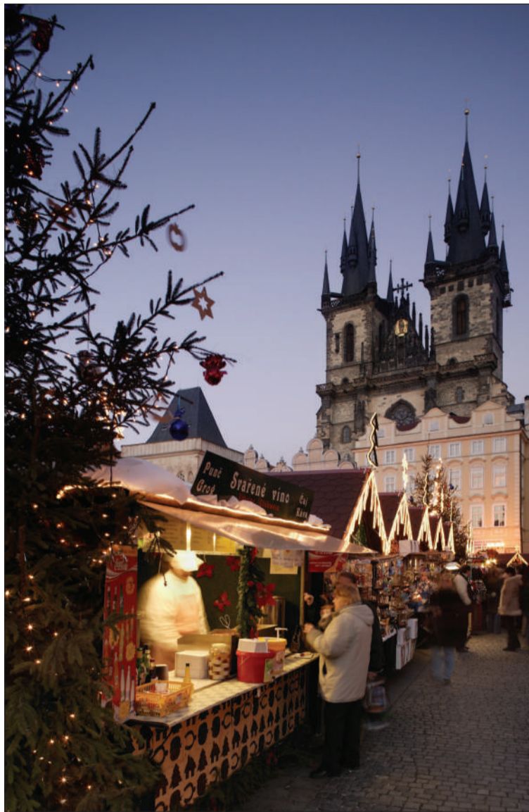
欧洲圣诞集市有的长达几十天,是当地人和游客们都爱去的地方。