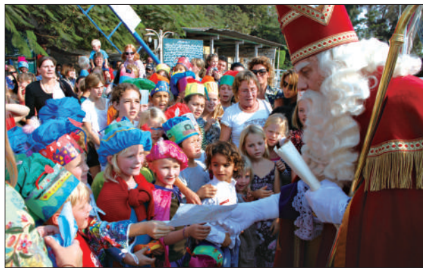
西班牙圣诞节充满浓郁的传统气氛(左图);法国阿尔萨斯的圣诞传统食品(右上);荷兰的圣尼古拉斯节(右下)。