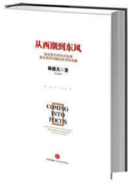
《从西潮到东风》 林毅夫 著 版本：中信出版社 2012年9月版 定价：59.00元

在表明责任与担当的同时，作者也表达了一定程度的乐观，认为学者和政策制定者们能洞悉问题的真正原因，跳出一国一城的局限，积极对话与合作，并采取迅速有效的行动，经济危机是可以避免或者减轻的。而其乐观的信仰基础则是，人类私人的努力与公共政策的目的，其指向，都是全体人类的幸福。因此，我们在他书中，不仅能感受到理智上的清健，更能感受到其深切而开阔的人道主义关怀。