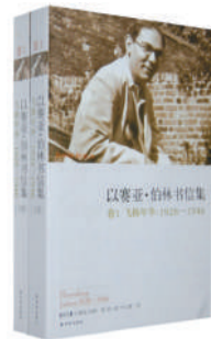
《以赛亚·伯林书信集》(卷1) (英)以赛亚·伯林著 版本：译林出版社 2012年8月版 定价：89.00元

其实，人而非抽象的思想理念，才是伯林最感兴趣的。他的朋友们也都曾提及与伯林交谈的快乐，不仅是他幽默有趣有见地，而且他总对别人的生活了如指掌，津津乐道人家的八卦轶事。而他自己则曾说：“人只有做到可以在好朋友面前肆无忌惮地说话，活着才有意义。”在伯林的书信集中，我们可以读到很多肆无忌惮的言论，当然，最重要的是，我们可以看到他达至肆无忌惮说话之境的过程，从年少时给彼时名家切斯特顿写信时的紧张与矜持，到后来与名家政要对话时的从容幽默，其背后正是伯林对自我的确立，他的思想日益周密成熟，他的写信的笔调也日益轻盈。