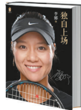
《独自上场》 李娜 著 版本：中信出版社 2012年8月版 定价：39.00元