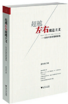
《超越左右激进主义》 萧功秦 著 版本：浙江大学出版社 2012年8月版 定价：48.00元